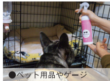
●ペット用品やゲージ