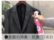
●衣服の消臭・抗菌 (※3)