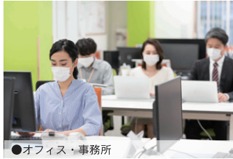
●オフィス・事務所