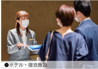
●ホテル・宿泊施設